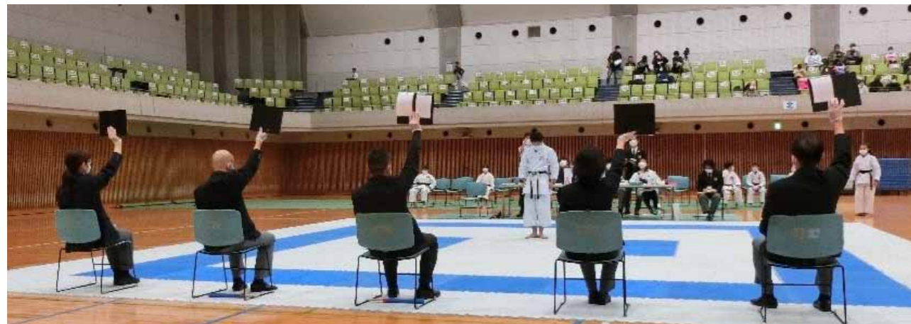
形試合、採点の様子