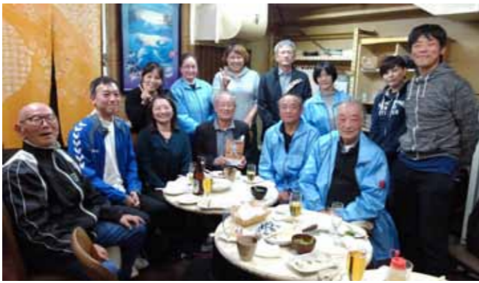
偲ぶ会に集まった13名の有志たち。 写真集(写真中央)を囲んで思い出話を花を咲かせる