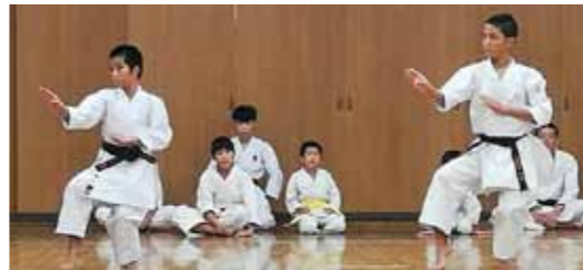
中学生によるバツサイ大