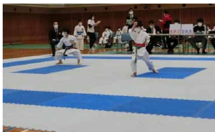
形試合でもマスクをつけて