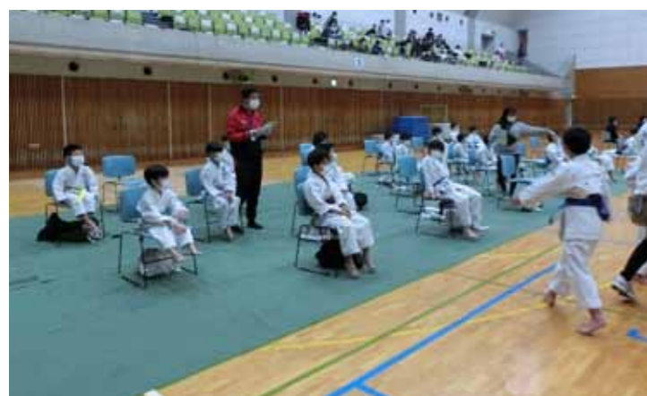
試合を待つあいだはソーシャルディスタンス

究し、保護者の皆様には、声を出して応援しないなど応援の仕方も考えていただきました。