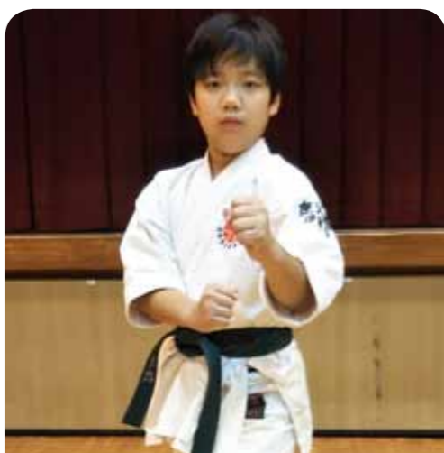
伊敷台スポーツ少年団