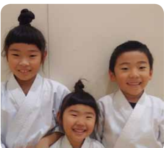
北海道支部 常明館