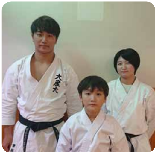
吹田青少年空手道教室