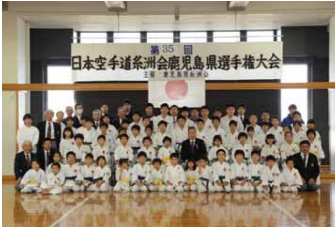
参加選手記念撮影

ました。今年度は参加選手を縮小しての開催でしたが今年最初で最後の大会ということで、いつもより気合が入り大会が盛り上がりました。試合の間はマスクを着用し選手同士会話を交わすなど同門の交流も図りました。2021年は九州プロックススポーツ少年団大会、2022年全国中学校空手道大会2023年「燃ゆる感動かごしま国体」開催が3年間続きます。年頭まず自ら意気を新たにすべし。九州糸洲会会員のさらなる活躍を期待します。(九州地区会報委員 井出俊郎)