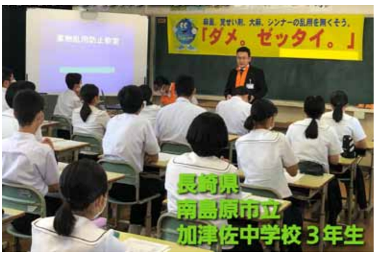
長崎県南島原市立加津佐中学校3年生

手道糸洲会監事、桜井市空手道連盟会長、奈良県空手道連盟常任理事・渉外委員会副委員長・倫理委員会委員など数々の要職について