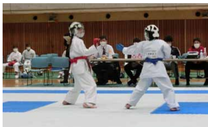
メンホーの中にマスク