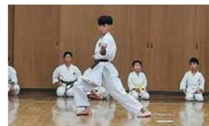
小学生によるバツサイ大