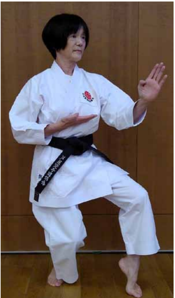
芦屋空手道協会所属 修行歴 34年

一方、「2021年をどう読み解くか」など、大胆な課題を会報委員長に投げかける知性豊かな女性です。その素顔を追ってみました。(会報委員長 林 開作)