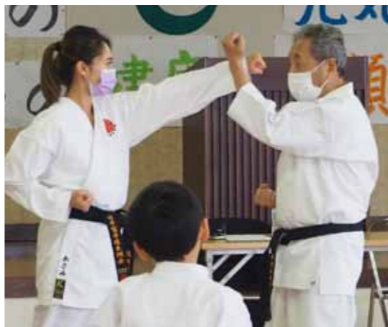
宗家の指導を受けるあさみ館長